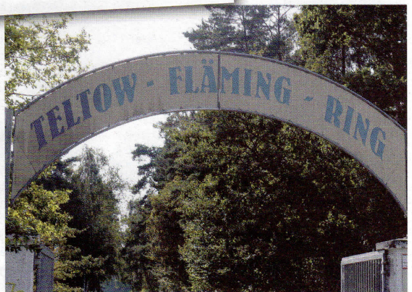
Auf dem Teltow-Fläming-Ring kann man den Alltag zum Abenteuer machen

Weiter geht es Richtung Zossen. Wir fahren über Schöneiche nach Kallinchen. Schon sind wir am zweiten Ziel angekommen. Hier gibt es den Teltow-Fläming-Ring – ein Rundkurs und Fahr-sicherheitszentrum –