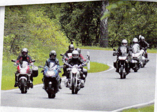
In der Gruppe kommt man am schönsten auf Tour