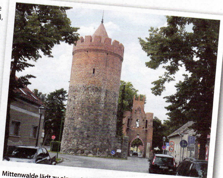
Mittenwalde lädt zu einem Ausflug in die Geschichte ein

U nd los geht's. Gestartet wird wieder an der Spinner-Brücke. Wir fahren stadtauswärts auf die BAB 115 und verlassen diese wieder an der Ausfahrt fünf (falls diese