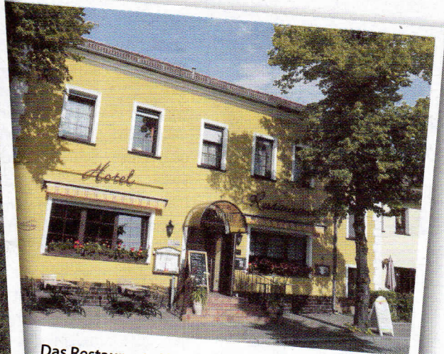
Das Restaurant „Alter Krug“ in Kallinchen macht müde Biker wieder munter