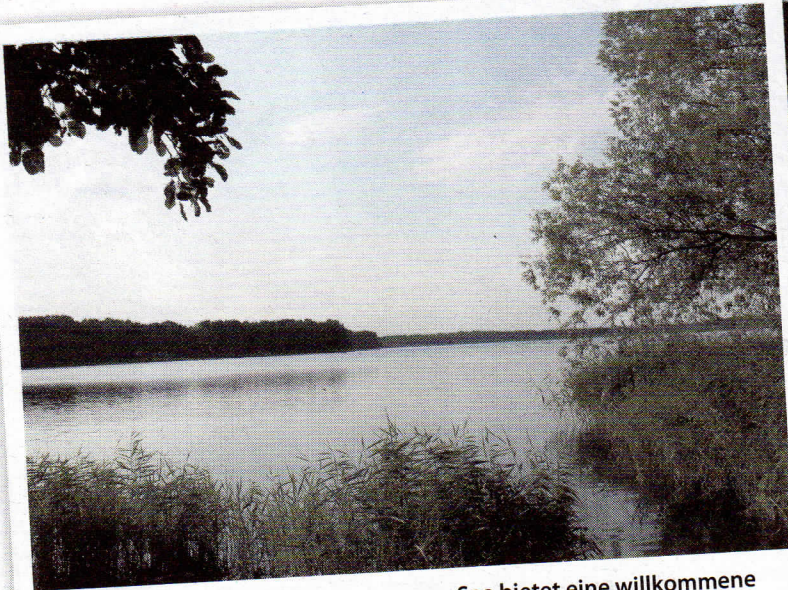
Das Strandbad am malerischen Motzener See bietet eine willkommene Erfrischung nach der „heißen“ Fahrt