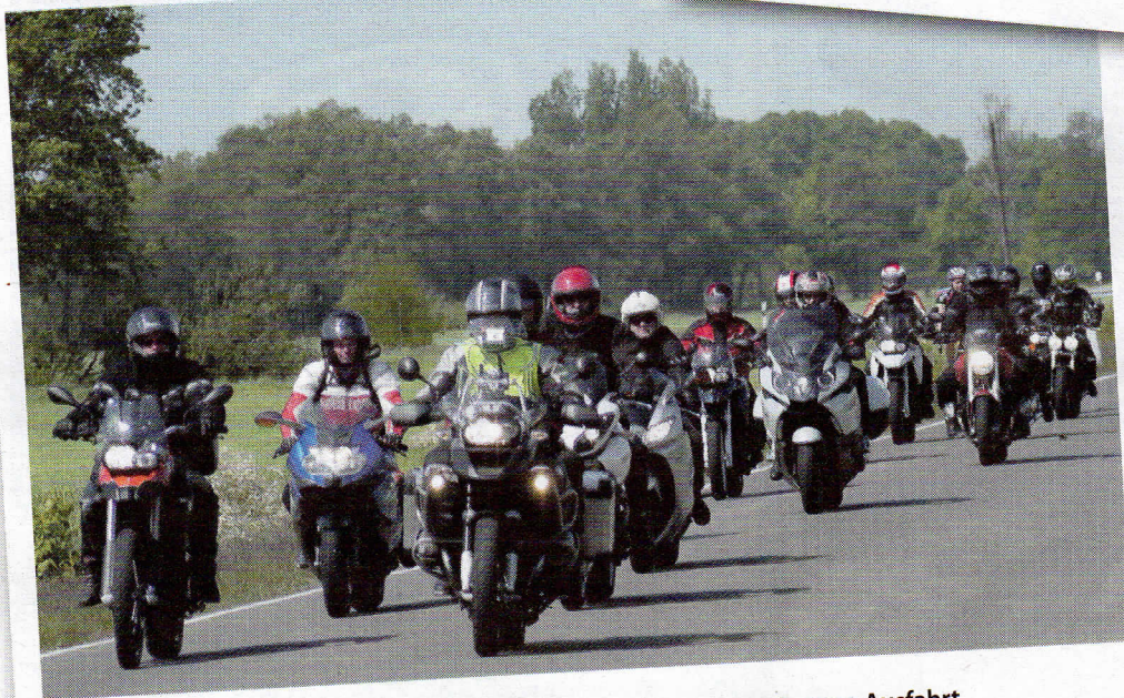
Für eingefleischte Biker ist immer passendes Wetter für eine gemeinsame Ausfahrt

sowie den Kletterwald Kallinchen. Beim Rundkurs sollte man sich unter der Telefonnummer (033769) 202010 anmelden oder die Webseiten fahrtechnikakademie.de oder tf-ring.eu besuchen. Der Kletterwald ist an Wochenenden ab 10.00 Uhr geöffnet. Darüber hinaus kann man sich auch hier unter der Telefonnummer (0176) 96508426 anmelden. Die Internetadresse heißt: kletterwald-kallinchen.de . Für eine Kaffee- oder Mittagspause bietet sich das Restaurant „Alter Krug“ in Kallinchen an.