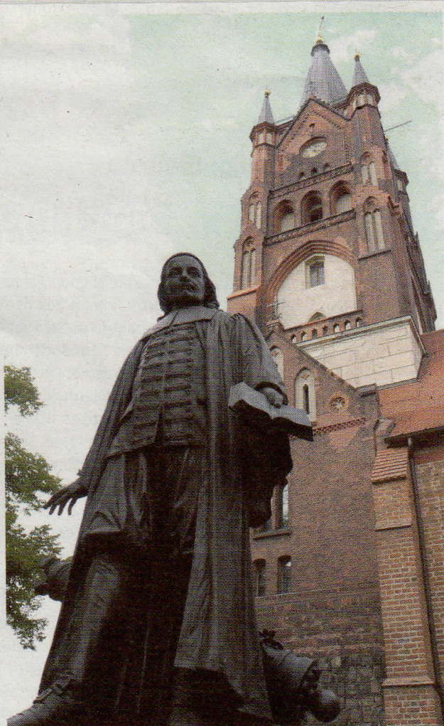
Ihrem ersten Ehrenbürger Paul Gerhardt hat die Stadt Mittenwalde vor der Pfarrkirche ein Denkmal gesetzt